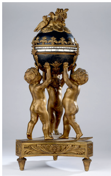
PENDULE AU GLOBE EN BRONZE CISELÉ ET DORÉ À CADRAN TOURNANT. ÉPOQUE NAPOLEÓN III. H. 54, L. 25, P. 25 CM — 2 500/3 500€