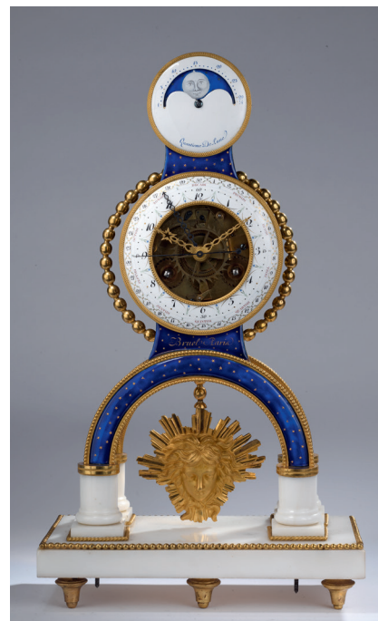
PENDULE SQUELETTE À COMPLICATIONS SIGNÉE BRUEL À PARIS, CIRCA 1795. H. 46,5, L. 27, P. 13,5 CM — 20 000/30 000€