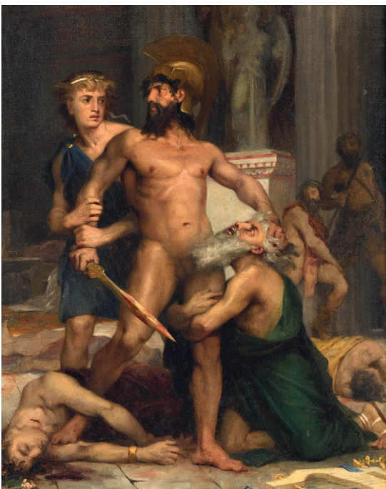
ÉCOLE FRANÇAISE CIRCA 1860 LA MORT DE PRIAM. HUILE SUR TOILE. 55X46,5 CM — 800/1 200€