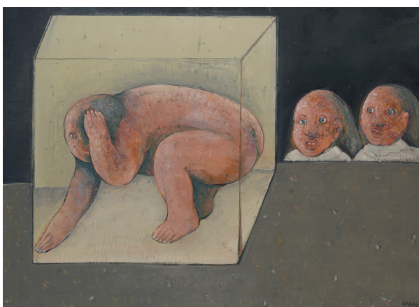
ABRAHAM HADAD (NÉ EN 1937) L'ENFERMÉ ET LES DEUX FILLETES. HUILE SUR TOILE. SIGNÉ ET DATÉ FÉV. 91. 97X130 CM — 1 500/2 000€