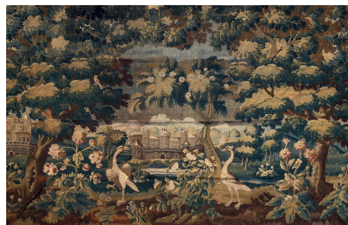
AUBUSSON TAPISSERIE VERDURE EN LAINE À DÉCOR D'ÉCHASSIERS. XVIII e SIÈCLE. 410X266 CM — 2 000/2 500€