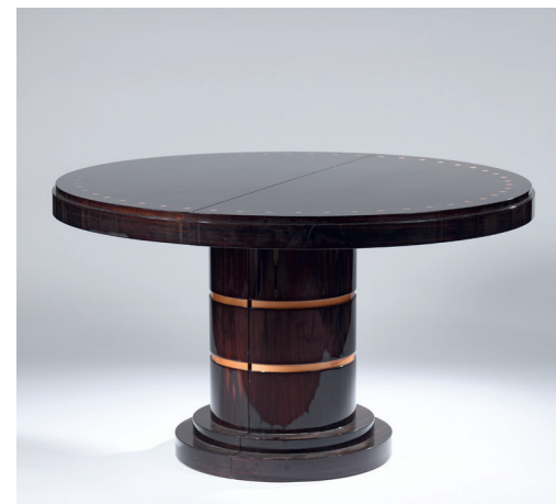
TABLE À MANGER CHARLESTON EN PLACAGE D'ÉBÈNE DE MACASSAR. MAISON HIFIGÉNY, PARIS, CIRCA 2010. H. 77 CM, DIAM. 130 CM — 3 000/4 000€