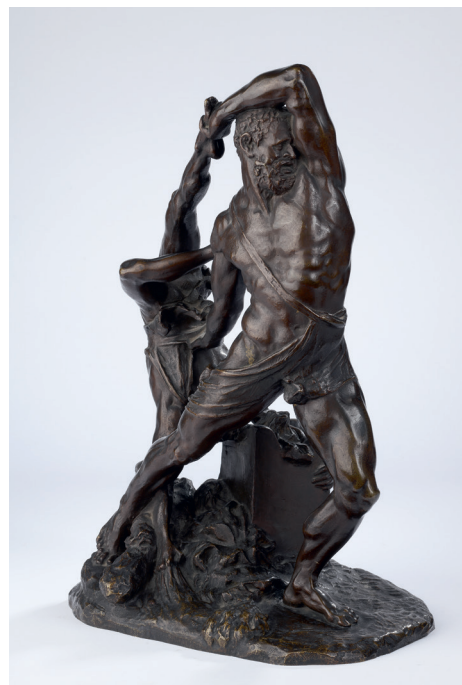
D'APRÈS ANTONIO CANOVAS (1757-1822) HERCULE ET LICHAS. BRONZE À PATINE BRUNE. H. 43, L. 27, P. 20 CM — 1 000/1 500€