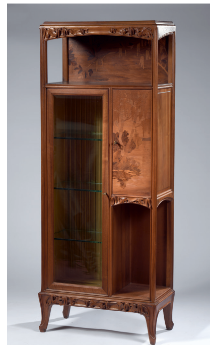
LOUIS MAJORELLE (1859-1926) VITRINE HAUTE EN BOIS MARQUETÉ ET SCULPTÉ DE CHATONS DE BOULEAU ÉPOQUE ART NOUVEAU. SIGNÉ ET SITUÉ À NANCY. H. 174, L. 73, P. 33 CM — 2 500/3 500€