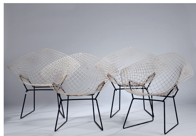
HARRY BERTOIA (1915-1978) POUR KNOLL INTERNATIONAL. SUITE DE QUATRE FAUTEUILS DIAMOND, À STRUCTURE EN FIL D'ACIER CINTRÉ, SOUDÉ ET LAQUÉ. H. 75, L. 85 CM