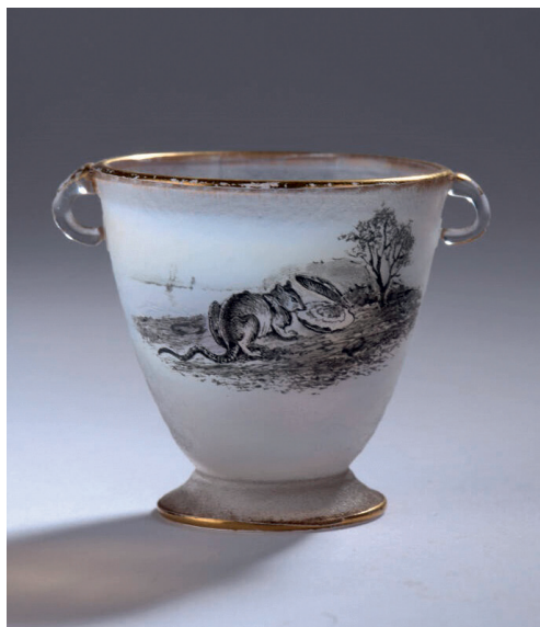
DAUM À NANCY. LE RAT ET L'HUÎTRE D'APRÈS LA FABLE DE LA FONTAINE. VASE EN VERRE GIVRÉ À DÉCOR EN GRISAILLE. SIGNÉ. H. 4,5 CM, DIAM. 4,5 CM — 300/400€