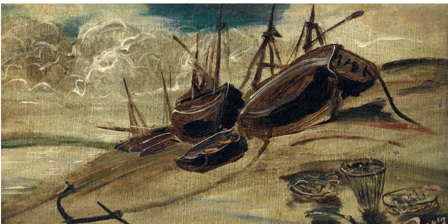
ANDRÉ DERAÏN (1880-1954) BARQUES ÉCHOUÉES ET PANIERS À HUITRES, CIRCA 1936. HUILE SUR TOILE MAROULÉE. SIGNÉ. 17X33 CM