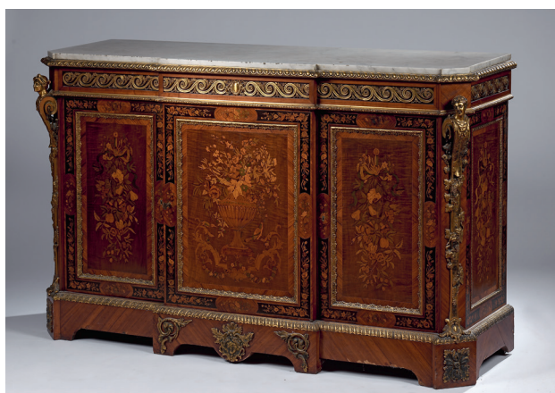
MONBRO AÎNÉ BAS D'ARMOIRE À HAUTEUR D'APPUI EN PLACAGE DE BOIS DE ROSE. ESTAMPILLÉ, ÉPOQUE NAPOLEÓN III. H. 100, L. 155, P. 50 CM — 4 500/6 500€